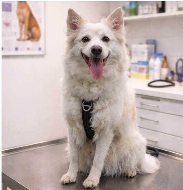
Enya (Cebali's Stardust) hos Al dyrlæge

Link til undersøgelsen: https://forms.cloud.microsoft/r/VK38nVE0f9