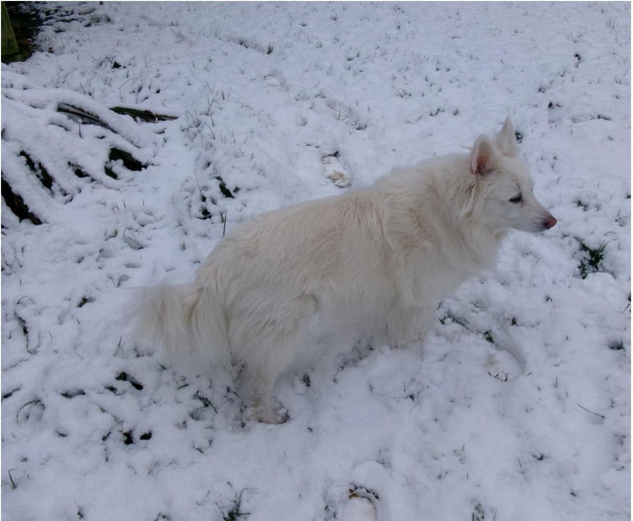
DKX-REG10651/2013 Spitha Cinna