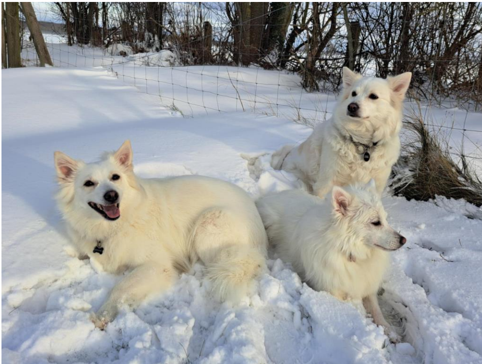
Kennel Danafrid i sneen – en Dansk Spids er Bisquit-farvet

Send en mail til formand@danskspids.dk hvis du har lyst og vi må skrive dig på.