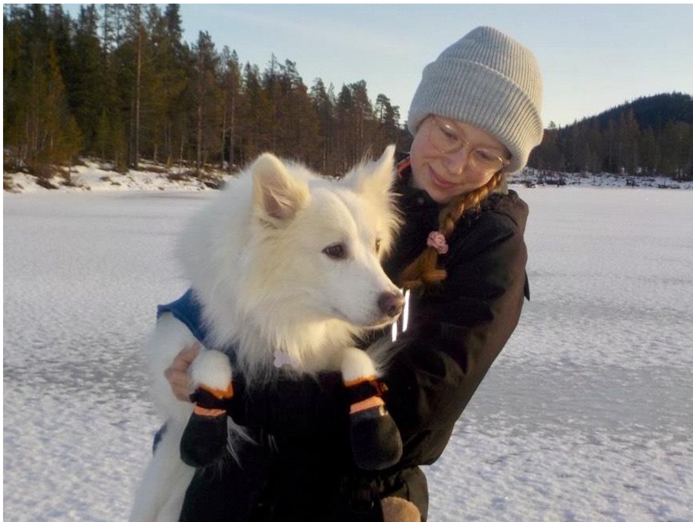
DKX-REG09049/2019 Capone (og Ea)

HUSK at vi rigtig gerne vil bringe billeder af og historier om din Dansk Spids i bladet, så