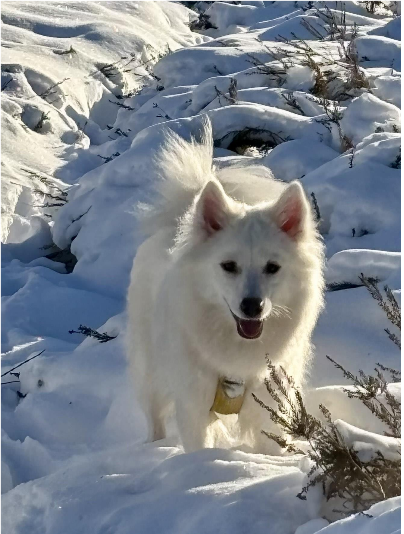
DKX-REG01649/2025 Friends N Fellows Bailey