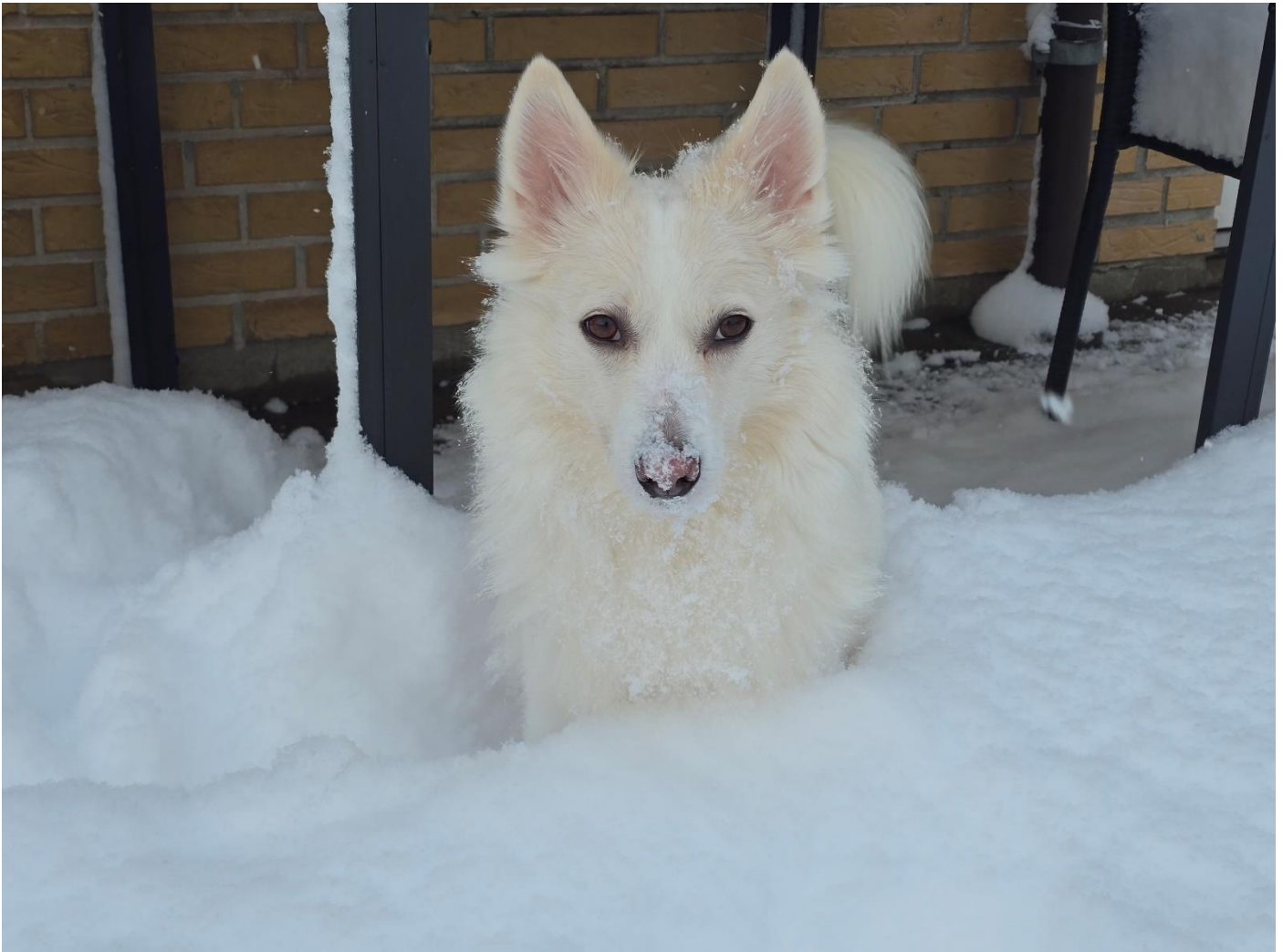
Jubiis Nelly DKX-REG16423/2019