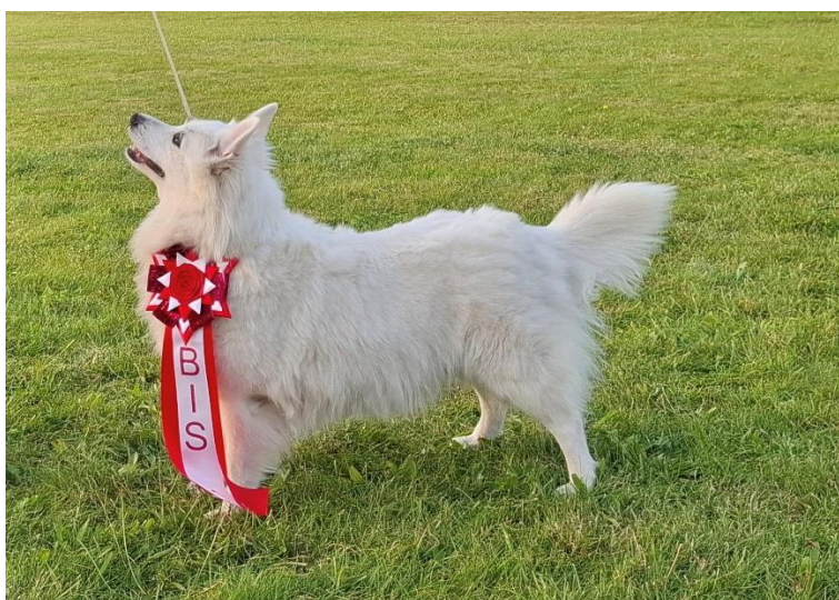
Tara blev både klubchampion og klub veteranchampion