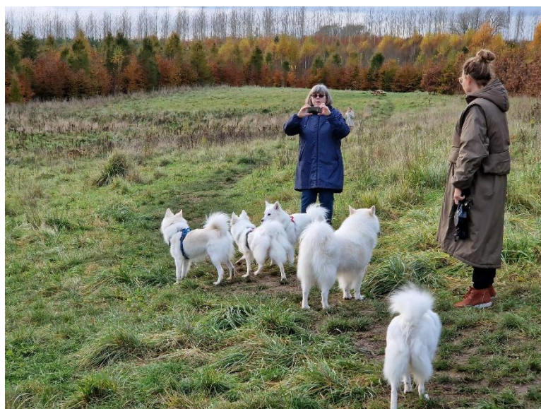
Billede fra gåturen på Fyn