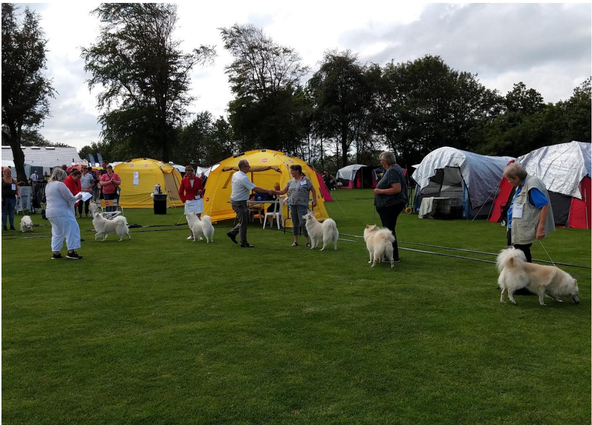
Så er det hannernes tur til at løbe en ekstra tur