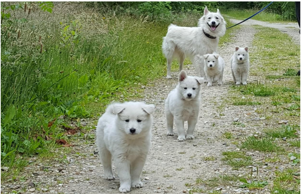
Hashfan Yankee på skovtur med sine og Frejas hvalpe.

I god tid inden løb sender du en kopi af tævens stambog. Man kan komme med ønsker til hanner, men det er avlsudvalget der træffer beslutningen om, hvilke hunde der kan sættes sammen. Husk at både tæve og han skal være mønstret for at blive godkendt til avl.