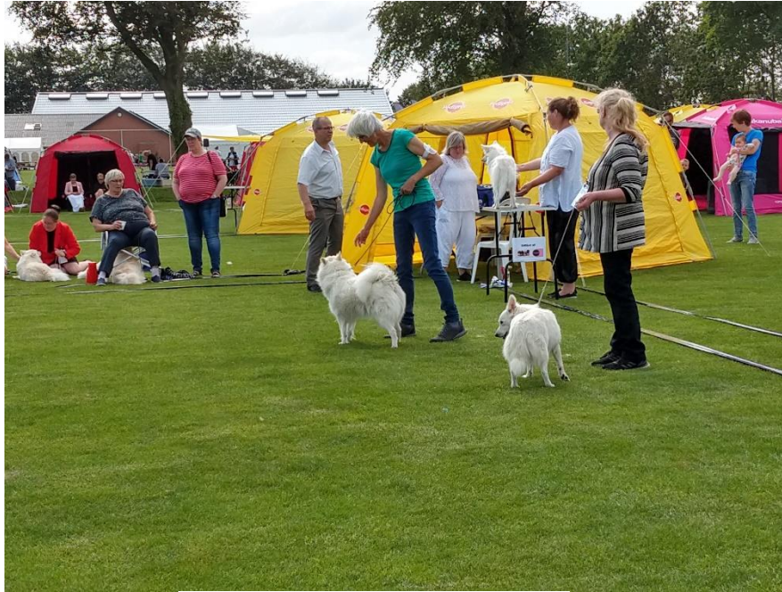
Udvælgelse af bedste hun