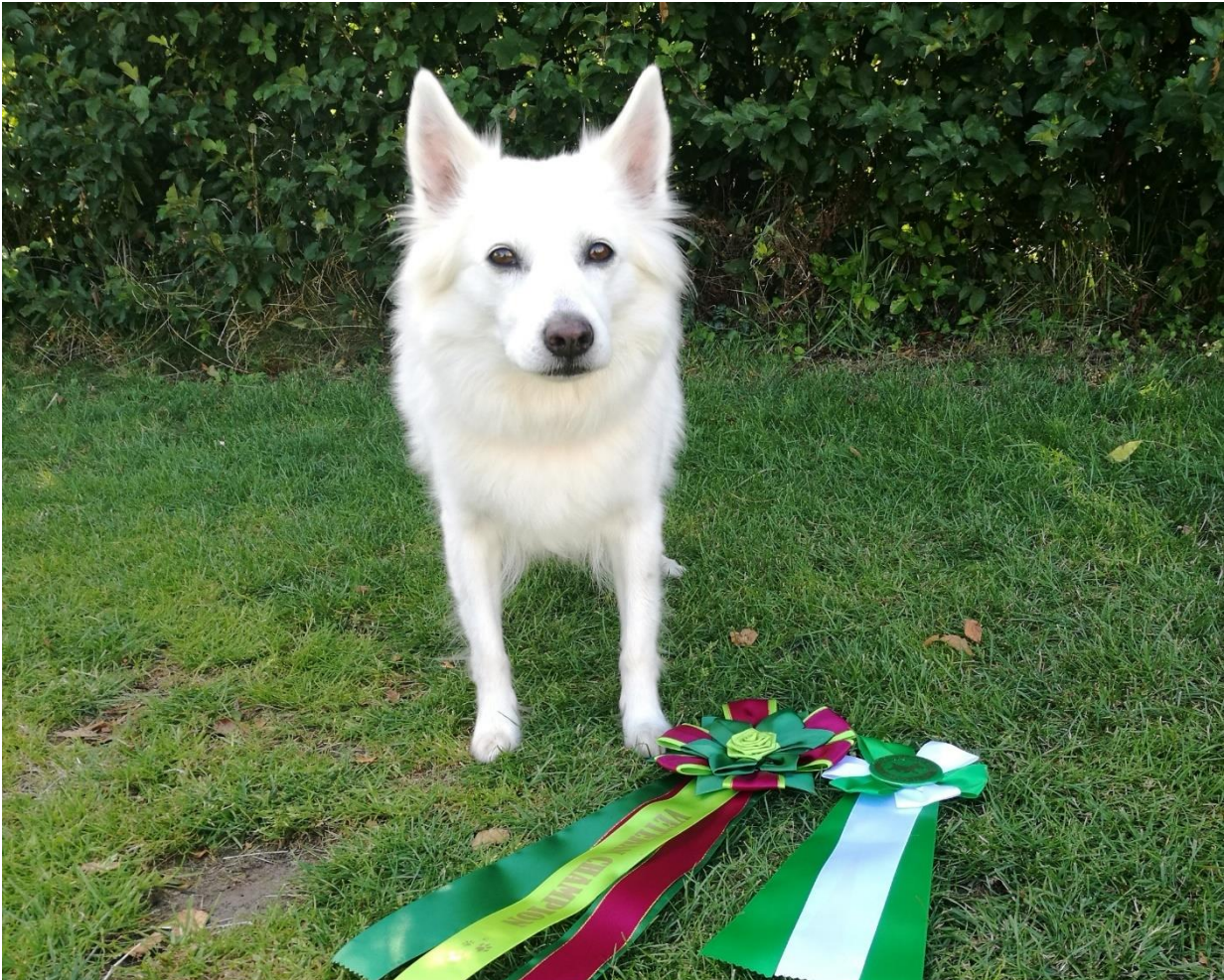
Lady DKX-REG11866/2008 DKVECH fik sit 3. cert. på Nordisk udstilling i Horne den 3. august og blev veteran Champion