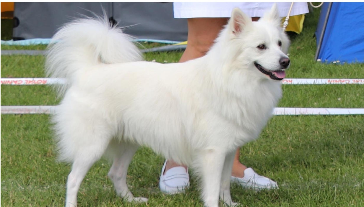
Gamle Danere's Multe DKX-REG20012/2016 DKCH har den 9. februar i Fredericia fået sit . 4. cert så han er nu Dansk Champion.