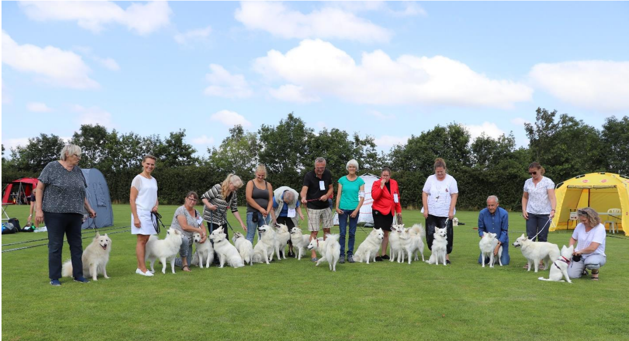
Fællesfoto taget efter udstillingen.

Omgivelserne var fine og vejret var skønt og jeg tror alle havde en rigtig dejlig dag.