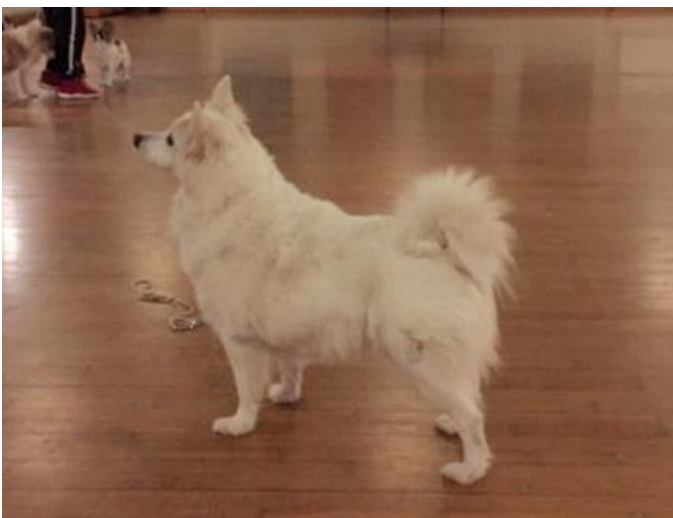
Tiffany. Klubbens 1. veteran champion. Ejer Dorte Gade

SDS takker for godt samarbejde med alle samarbejdspartnere.