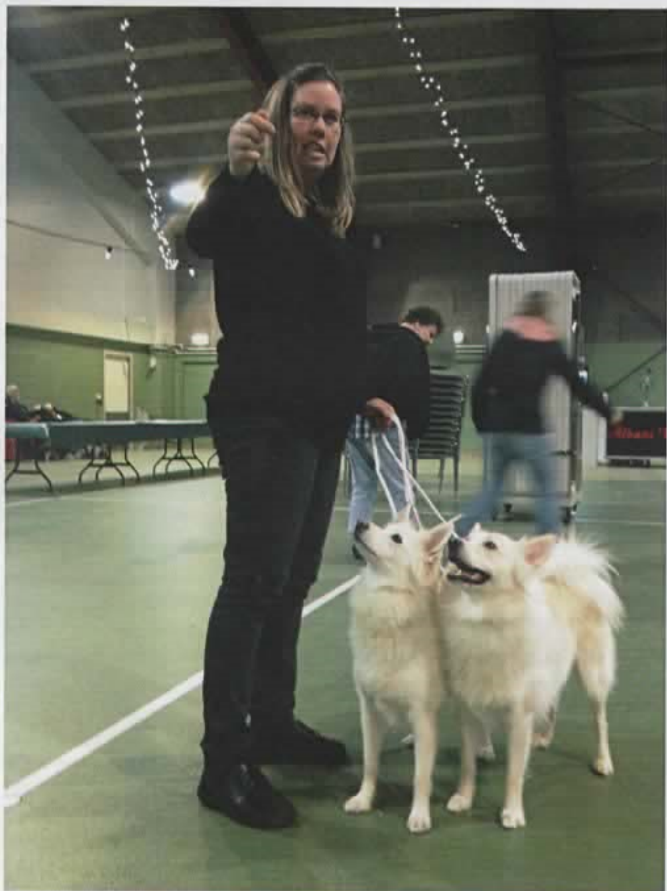
Vinder af parklassen på Spidshundeudstillingen i Nyborg 2012 - Tillykke