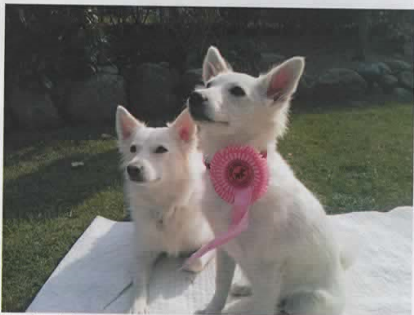
Mor og datter – bedste baby 3/5 2013 i Roskilde