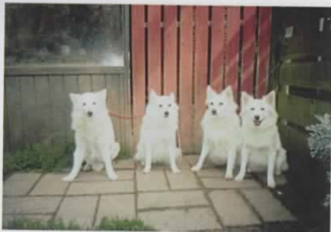
Jeg ved godt at vi har haft det før – men jeg synes at det er flot med 4 generationer registreret Dansk Spids