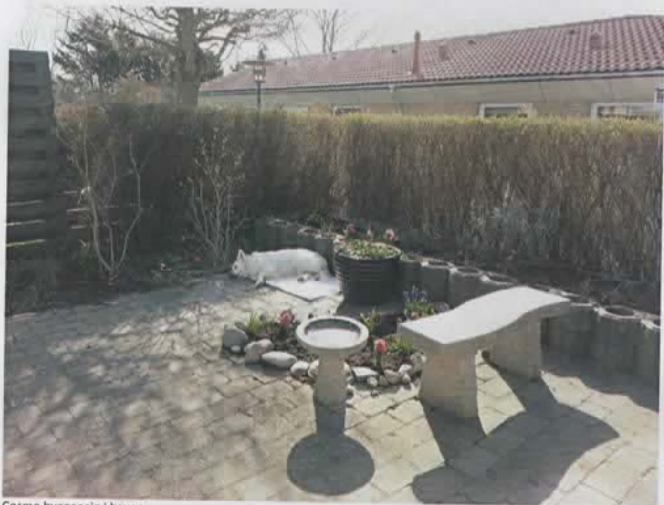
Cosmo hygger sig i haven