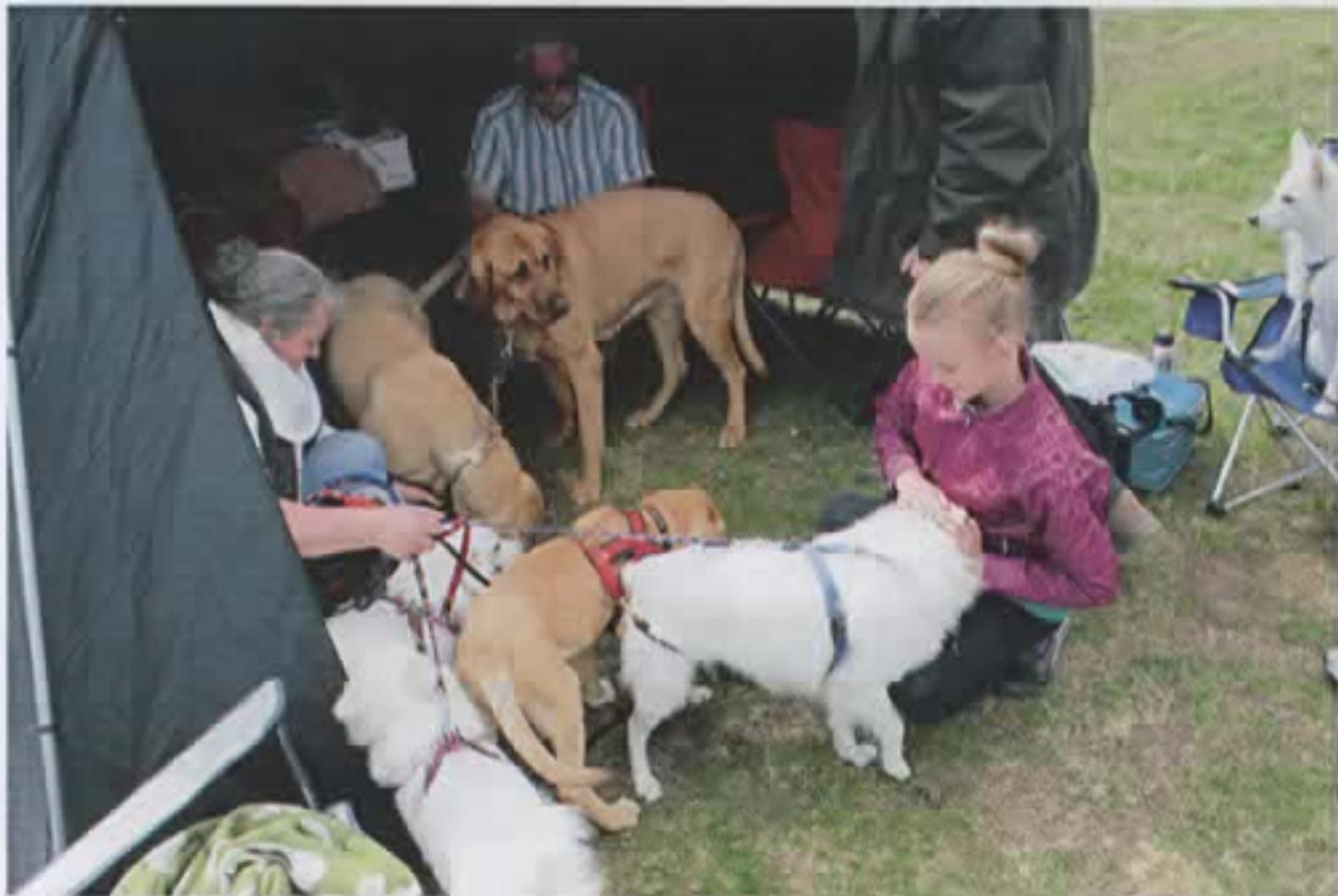
Hygge i Roskilde