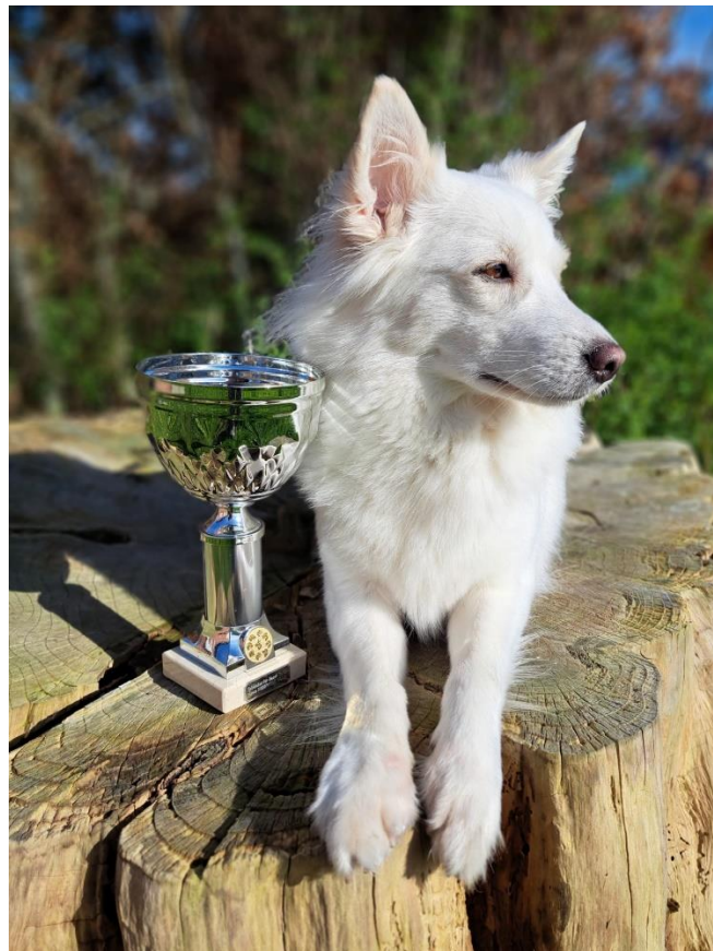
Årets Noseworkhund Danafrid's Be My Super Karla