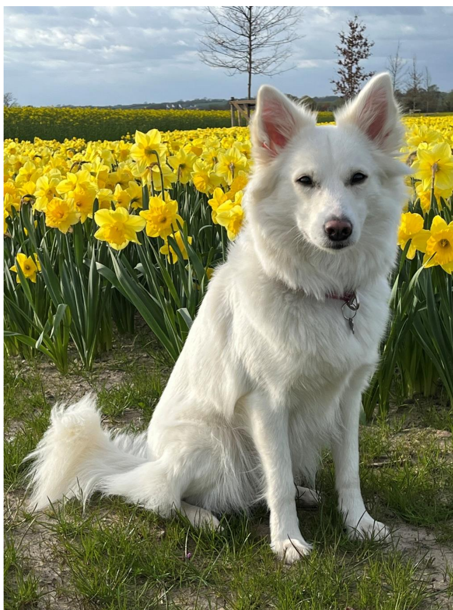
Danafrid Be My Happy Girl