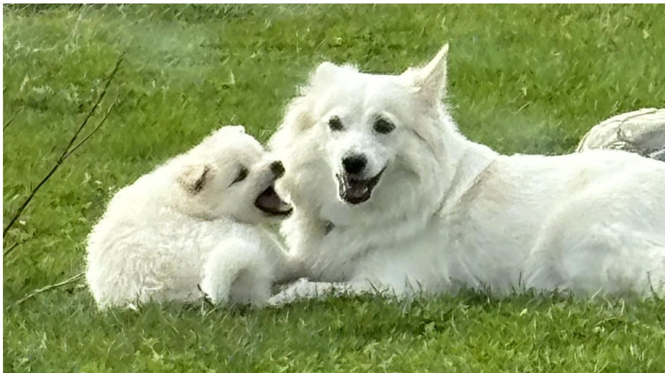
Jubii's Prinsesse Bella og Friends N Fellows Alba

https://www.hundeweb.dk/dkk/public/openIndex?ARTICLE_ID=23