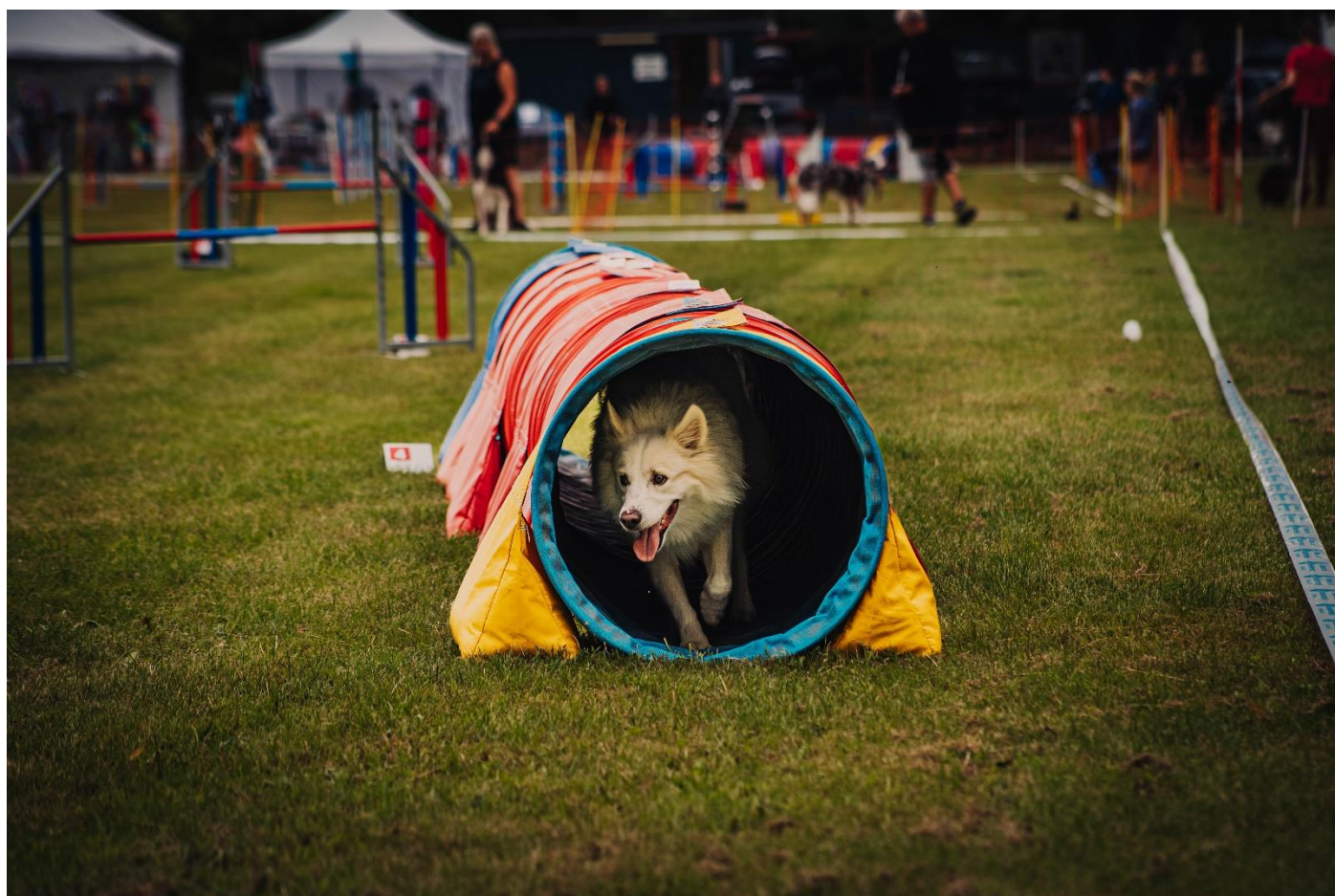
DKX-REG09049/2019 Capone