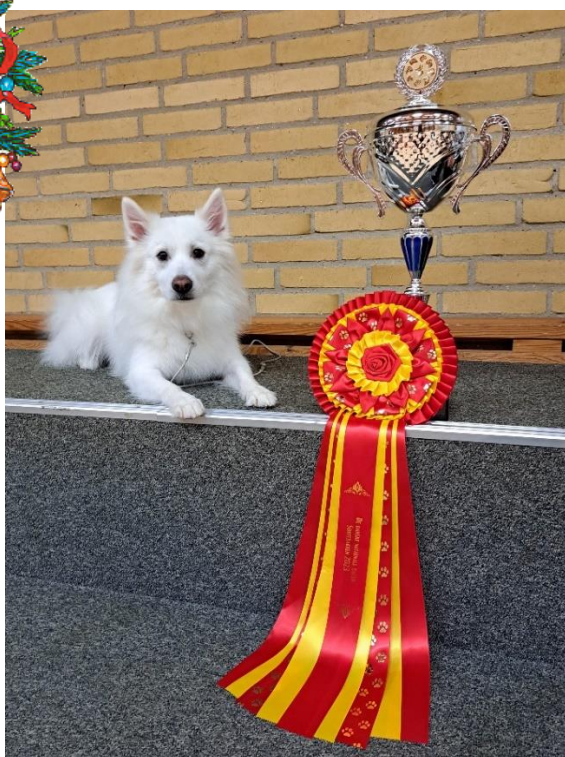
BIM og BIR