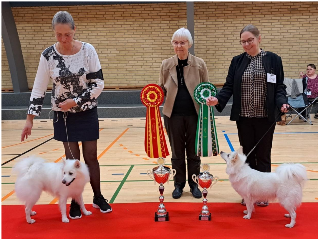
Fællesudstillingen for de danske nationale racer 2023 BIR Nerfe og BIM Jubii's Prinsesse Bella

Generalforsamling 2024 Sjælland 16. marts 2024