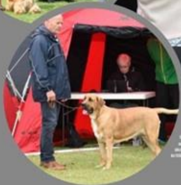
Skou i taktet østler sammeltalen og afsløre dokumenter i taktet ord.

Hvis man er interesseret i at vide mere, så besøg www.dkk.dk for yderligere oplysninger.