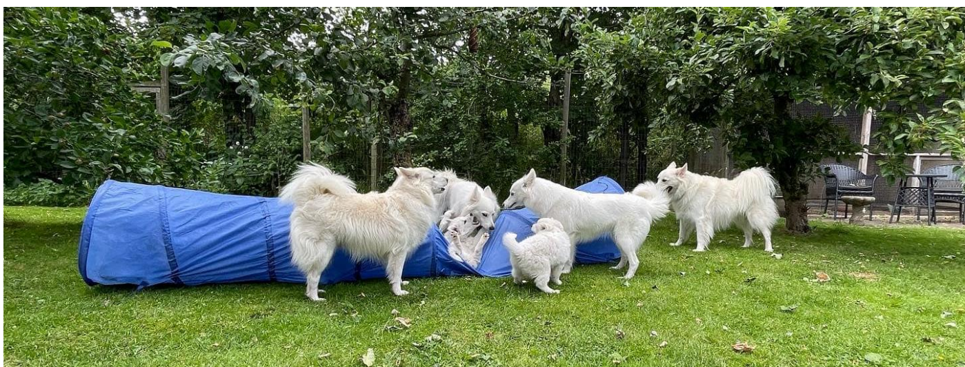
Canine Pegasus sommer 2022

(SPK = Spidshundeklubben - pr 26/11 2022 kan Dansk Spids ikke længere deltage i "Store ring")