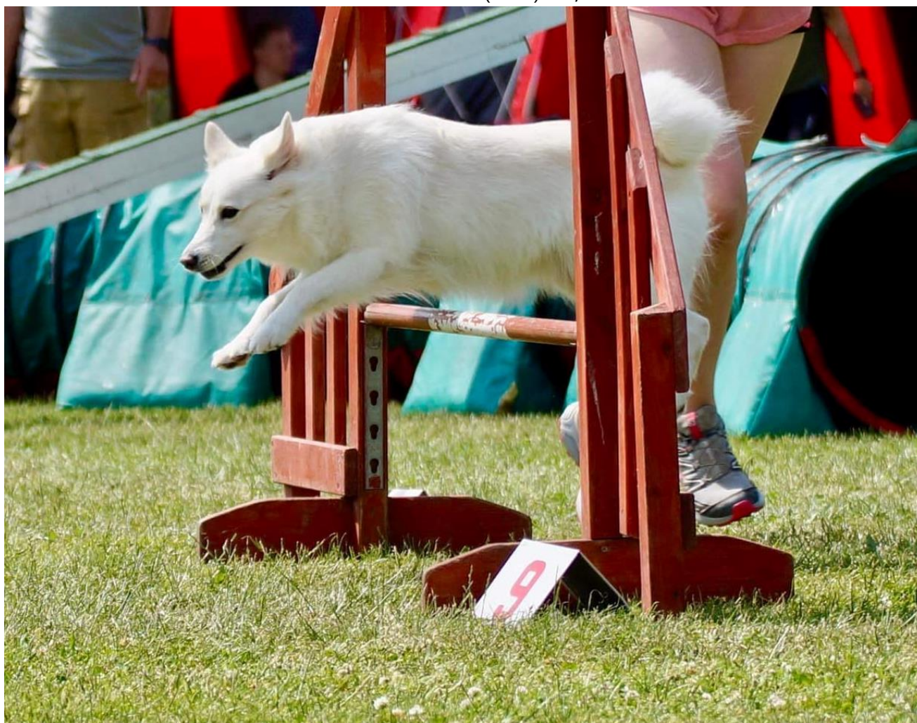
Cebali's Winter Star (Dina) 5 1/2 år –