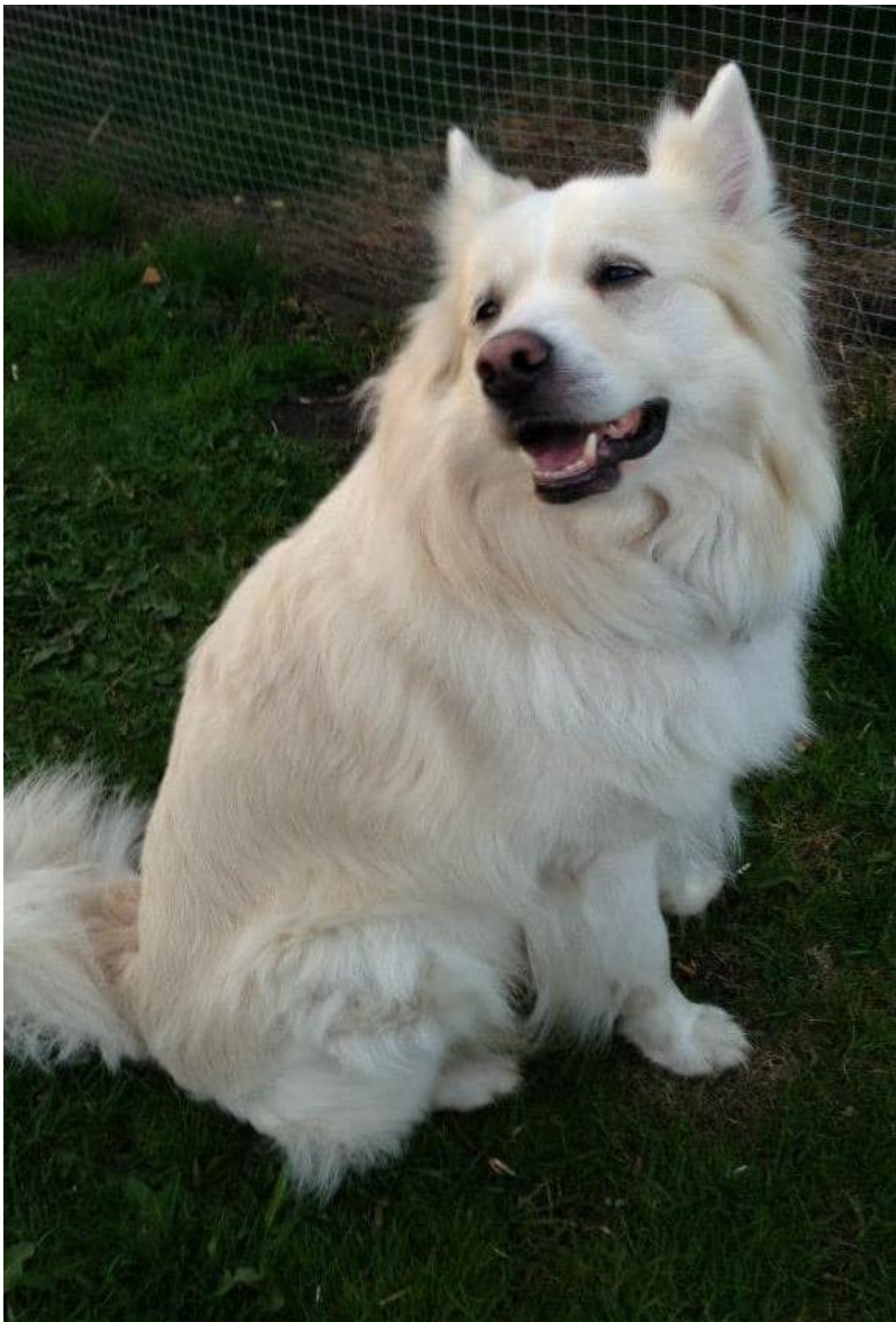
Spitha Warren Zevon (Bianco 2005 – 2017)