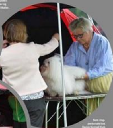
Skou stiger præsentation Danish Kennel Klub kommer man helt tæt på sandske Netværke frunde.