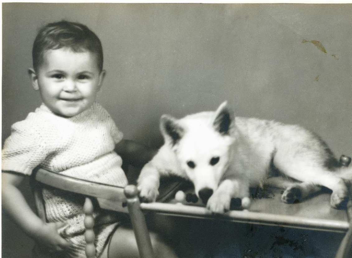
Privatfoto ca 1944

- Når avlsudvalget finder den eller de hanhunde der passer præcis til din tæve, så er landsdel ikke en del af beslutningen. Det er eksteriør og temperament. Vi har heldigvis en dansk race, så vi skal ikke til udlandet, som mange andre racer. Det er kun få opdrættere i Norden der skal rejse til Danmark for mønstring og parring. Når man vælger en dansk spids og opdræt af denne, så er man med i rekonstruktionen af racen, arbejdet med at få dansk spids FCI godkendt og dermed også at følge de retningslinjer der er for en rekonstruktionsrace.