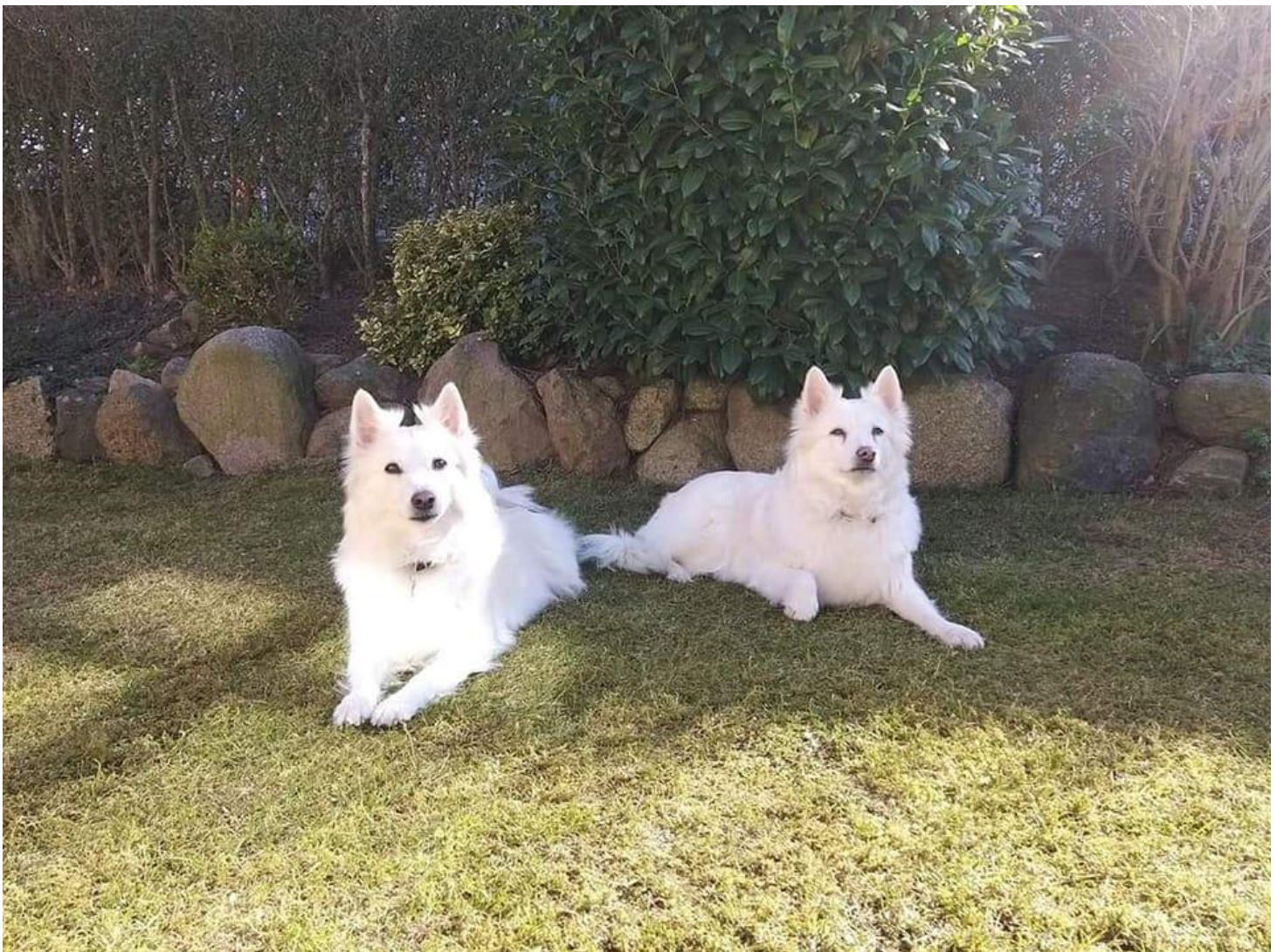
DKX-REG01030/2011. Abby (Frida) og DKX-REG01253/2013 Alma