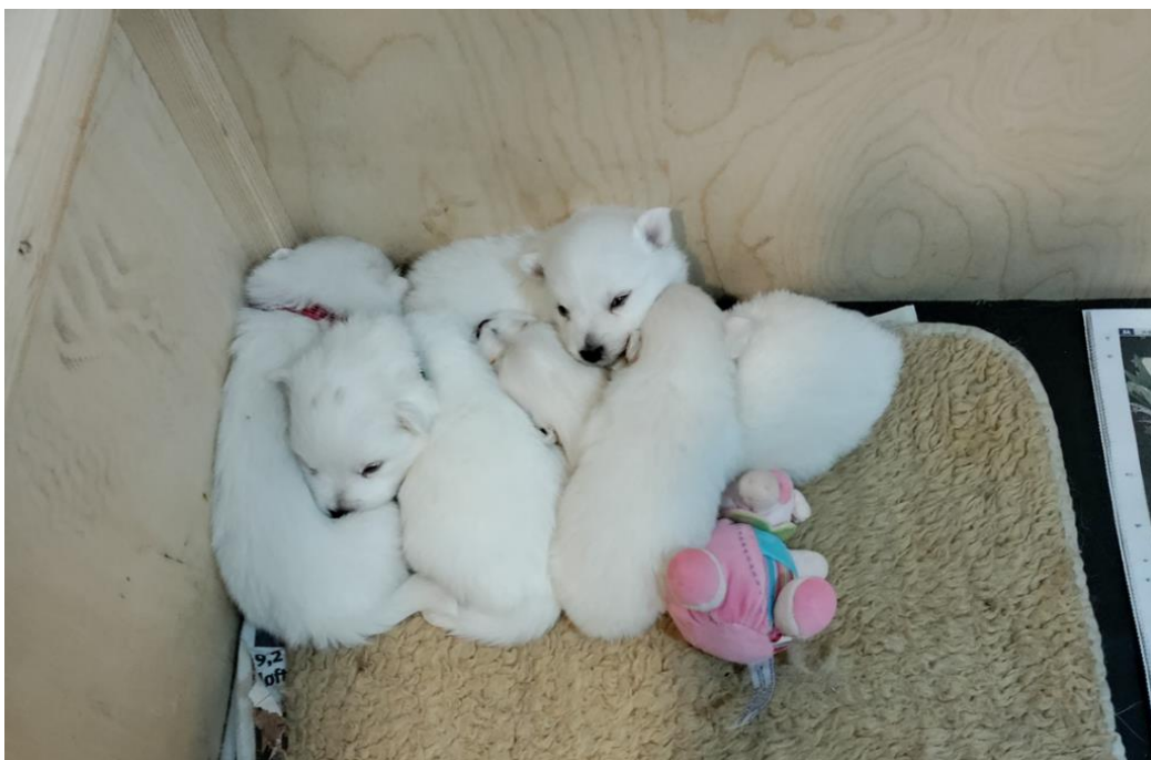
Hvalpe efter Laica og Bubbi

Ovenstående kan tage 1-2 måneder når det hele går godt og herefter skal tæve og hanhundeejer også gerne have tid til at aftale det praktiske. Så 3 måneder er ingen tid og hellere ansøge i god tid (og gerne i løbetiden før)