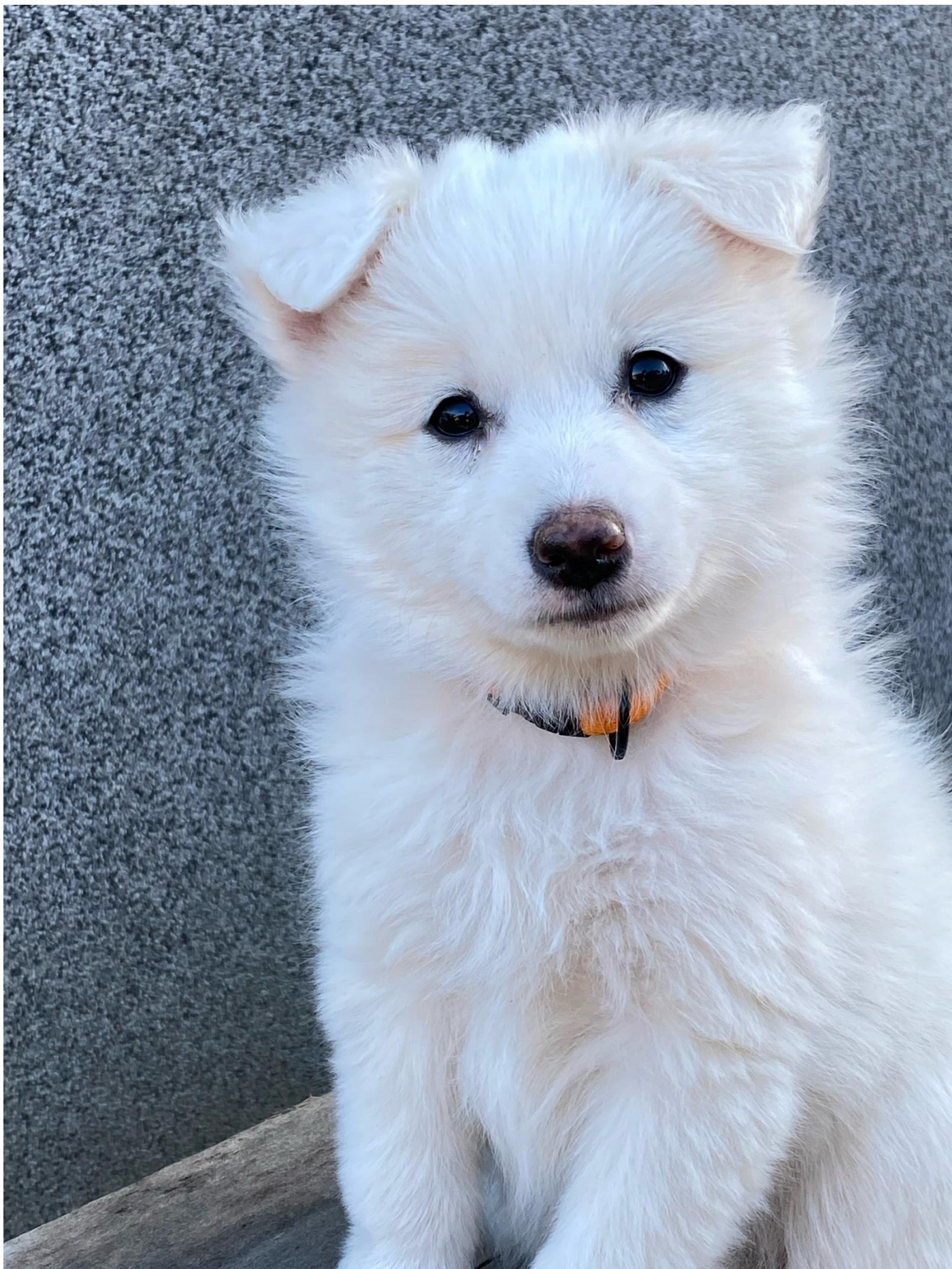
Hvalp efter Cebali 'S Winter Star (Dina) og Jubii's Oskar