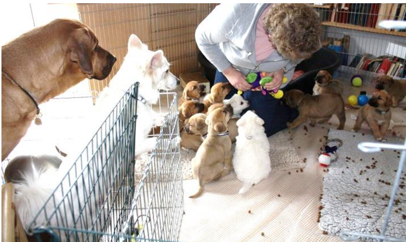
Gamle Danere 2011