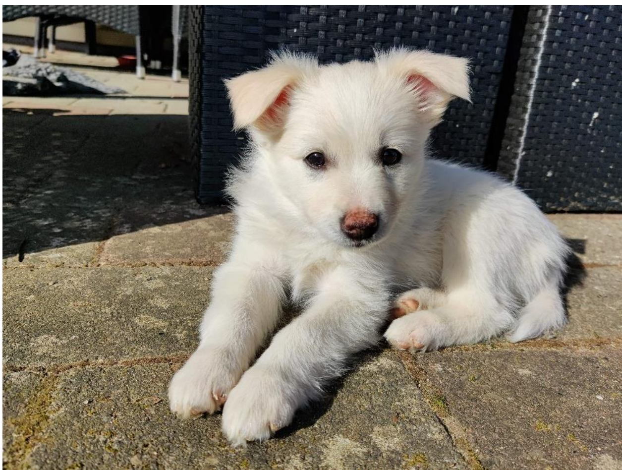
Hvalp efter Cebali 'S Winter Star (Dina) og Jubii's Oskar