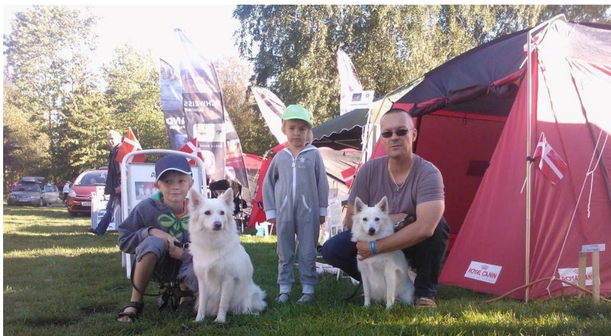
DKX-REG01030/2011. Abby (Frida) og DKX-REG01253/2013 Alma

Og se mere om Store Hestedag på www.storehestedag.dk