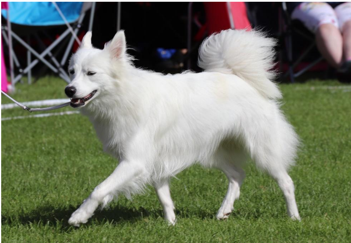
Cleo - DKX-REG12369/2018 på udstillingen i Vejen