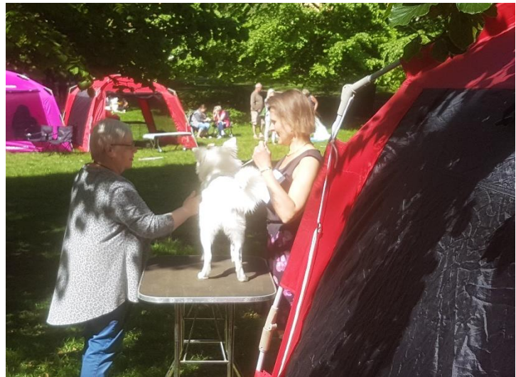
Bakkeskuet Kristi himmelfart 2017

Hvis du har lyst til at prøve kræfter med at udstille, er det en god ide at starte med ringtræning. På hundeweb kan du finde den ringtræning, som er under DKK. Jeg har mødt mange søde og hjælpsomme mennesker og fået mange gode råd og tips. Jeg er selv startet på denne måde uden noget forhåndskendskab til udstillinger, da Ludvig er min første hund.