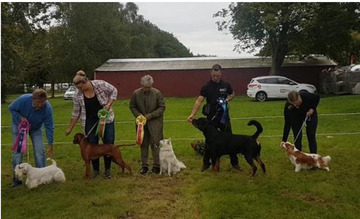
Store hestedag i Roskilde 8 september 2019